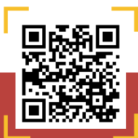
QR CODE คลัง SNAP

งานวิจัยฉบับนี้ชี้ให้เห็นถึงความท้าทายที่ภาคประชาชนต้องเผชิญในการเข้าถึงกระบวนการนโยบาย โดยเฉพาะข้อจำกัดในการรวบรวมรายชื่อและการได้รับการรับรองจากนายกรัฐมนตรีเพื่อเสนอร่างกฎหมายที่เกี่ยวข้องกับการเงินอย่างยิ่ง อีกทั้งได้นำเสนอตัวแบบการเสริมสร้างความเข้มแข็งของภาคประชาชนในกระบวนการนโยบายและการขับเคลื่อนร่างกฎหมายให้ได้รับการพิจารณาและบังคับใช้ได้อย่างมีประสิทธิภาพ