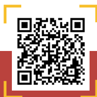
QR CODE อ่านหนังสือออนไลน์