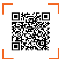
QR CODE อ่านหนังสือออนไลน์