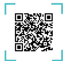
QR CODE อ่านหนังสือออนไลน์