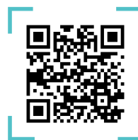
QR CODE คลัง SNAP