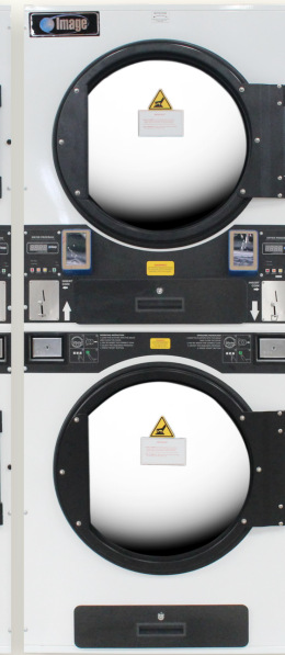
SDC-35 (อบ 16 kg.)