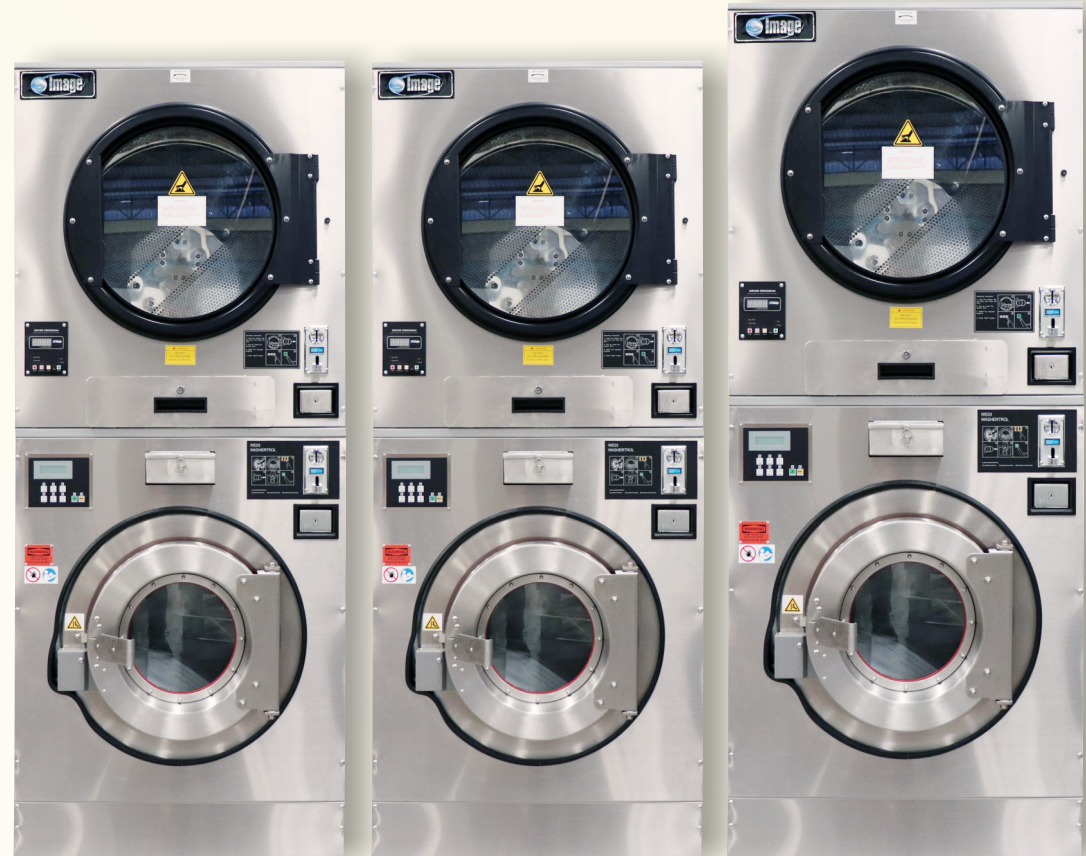
WDC-2035 (ซัก 10 kg. - อบ 16 kg.)