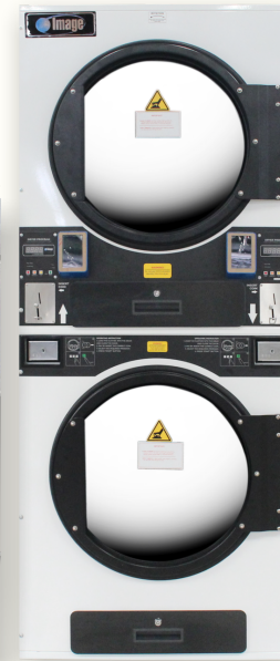
SDC-35 (อบ 16 kg.)