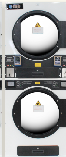
SDC-35 (อบ 16 kg.)