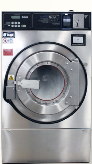
HC-20 (ซัก 10 kg.)