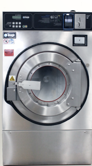
HC-20 (ซัก 10 kg.)