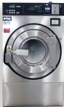
HC-20 (ซัก 10 kg.)