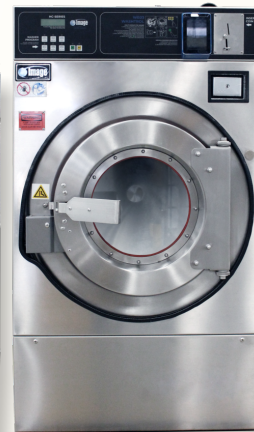
HC-60 (ซัก 30 kg.)