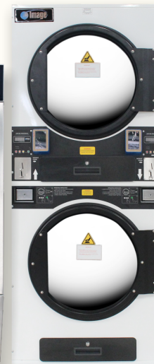
SDC-35 (อบ 16 kg.)