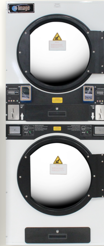
SDC-35 (อบ 16 kg.)