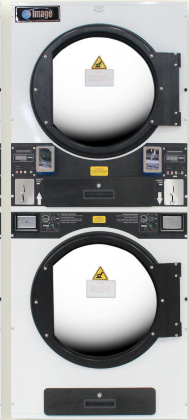
SDC-35 (อบ 16 kg.)