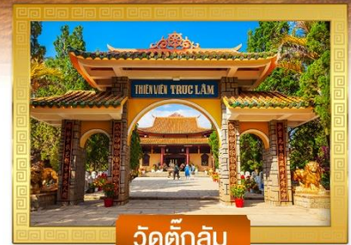
วัดดักลิ้ม