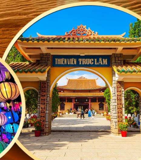
วัดตักลัม