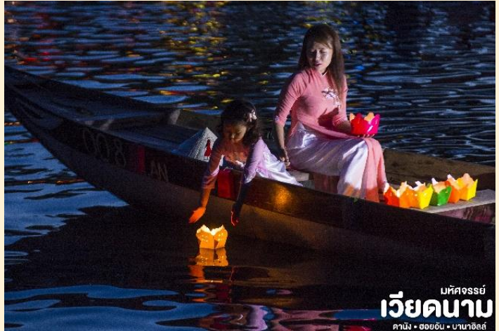
บหคจรรย เวียดนาม ดานัง • ฮอยอัน • นานาฮิลล์

ที่พัก เข้าสู่ที่พัก TTC HOI AN 4* หรือเทียบเท่ามาตรฐานเวียดนาม (โรงแรมที่ระบุในรายการทัวร์เป็นเพียงโรงแรมที่นำเสนอเบื้องต้นเท่านั้น ซึ่งอาจมีการเปลี่ยนแปลงแต่โรงแรมที่เข้าพักจะเป็นโรงแรมระดับเทียบเท่ากัน)