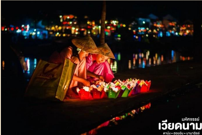
บหคจรรย เวียดนาม ดานัง • ฮอยอัน • นานาฮิลล์