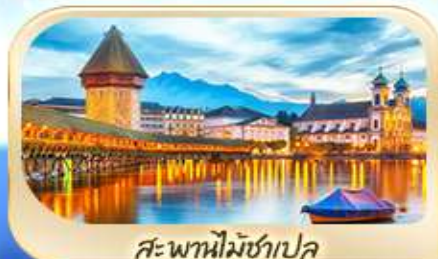
สะพานไมซ์ฮาป