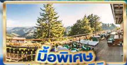
มือพิเศษ บินยอดเขาริธิ