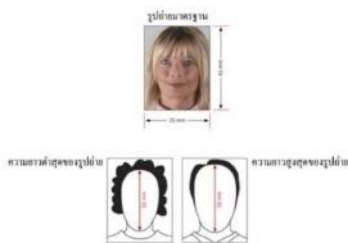
รูปถ่ายมาตรฐาน