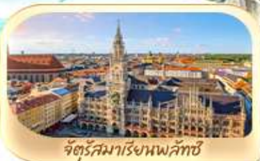
จัตุรัสมาเรียนพลัทซ์