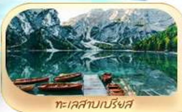
ทะเลสาบเบรียงส์