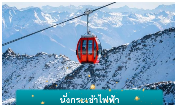
นั่งกระเช้าไฟฟ้า