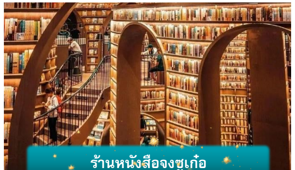
ร้านหนังสือจุงซูเก๋อ

เที่ยง บริการอาหารกลางวัน ณ ภัตตาคาร พิเศษ ... เมนูสุกี้หม่าล่า นำท่านเดินทางกลับ เมืองเฉิงตู เมืองเอกแห่งมณฑลเสฉวน เต็มไปด้วย เสน่ห์ของวิถีชีวิตสบาย ๆ รสชาติอาหารเผ็ดจัดจ้าน และเป็นบ้านเกิดของแพนด้ายักษ์ (ใช้เวลาเดินทางประมาณ 1 ชั่วโมง)