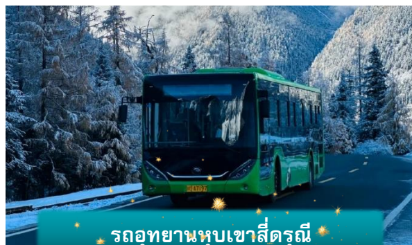
รถอุทยานหุบเขาสีตรุณี