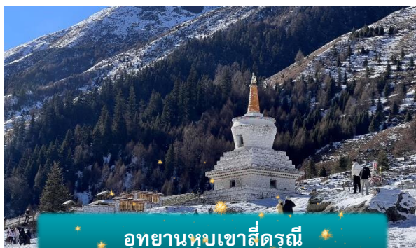
อุทยานหุบเขาสีตรุณี

ที่พัก VALA TOMS HOTEL เทียบเท่าหรือระดับ 4 ดาวท้องถิ่น