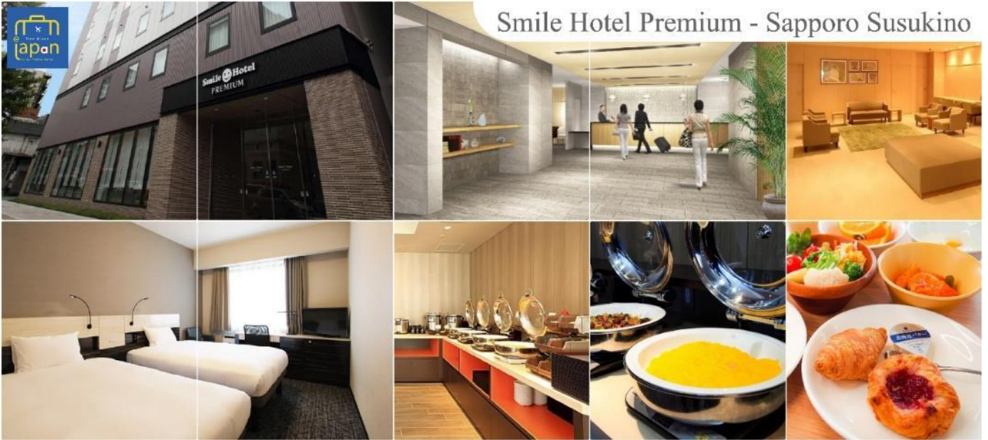
Smile Hotel Premium - Sapporo Susukino

SMILE HOTEL PREMIUM - SAPPORO SUSUKINO หรือเทียบเท่าระดับเดียวกัน