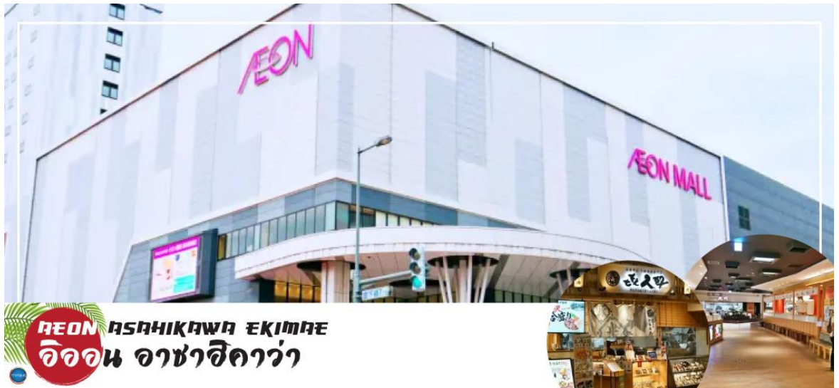
AEON ASAHIKAWA EKIMAE อโณ อาซาฮิคาว่า

นำท่านช้อปปิ้ง ณ อโณ อาซาฮิคาว่า (AEON Asahikawa Ekimae) ห้างสรรพสินค้าขนาดใหญ่ของสาขาสาฮิคาว่า อีสระให้ท่านได้เลือกซื้อของฝาก ของที่ระลึกกัน อาทิ ขนมโมจิ เบนโตะ ผลไม้ และขนมชั้นชื่อของญี่ปุ่น อย่าง คิทแคท สามารถหาซื้อได้ที่นี้เช่นกัน