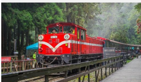
อุทยานแห่งชาติตาสีซาน