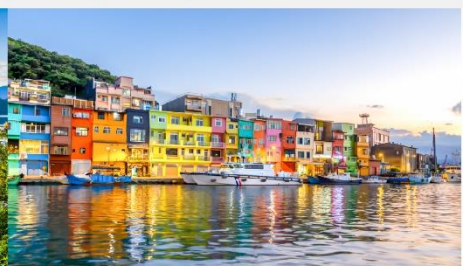
ทำเรือประมงเจิ้งปิ่น

*ทางบริษัทฯ ขอสงวนสิทธิ์ในการสลับโปรแกรมทัวร์ตามความเหมาะสมขึ้นอยู่กับสถานการณ์หน้างาน โดยคำนึงถึงผลประโยชน์ของลูกค้าเป็นสำคัญ