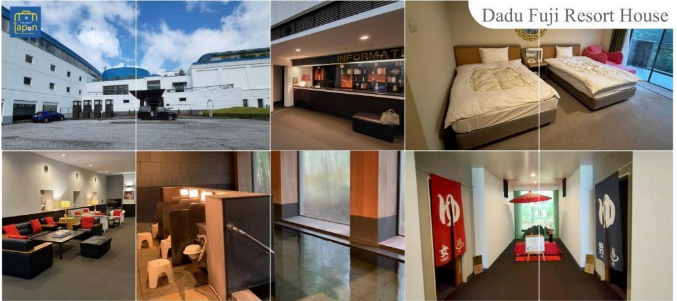
Dadu Fuji Resort House

หลังอาหารให้ท่านได้ผ่อนคลายกับการแช่น้ำแร่ธรรมชาติ เชื่อว่าถ้าได้แช่น้ำแร่แล้ว จะทำให้ ผิวพรรณสวยงามและช่วยให้อวัยวะระบบหมุนเวียนโลหิตดีขึ้น