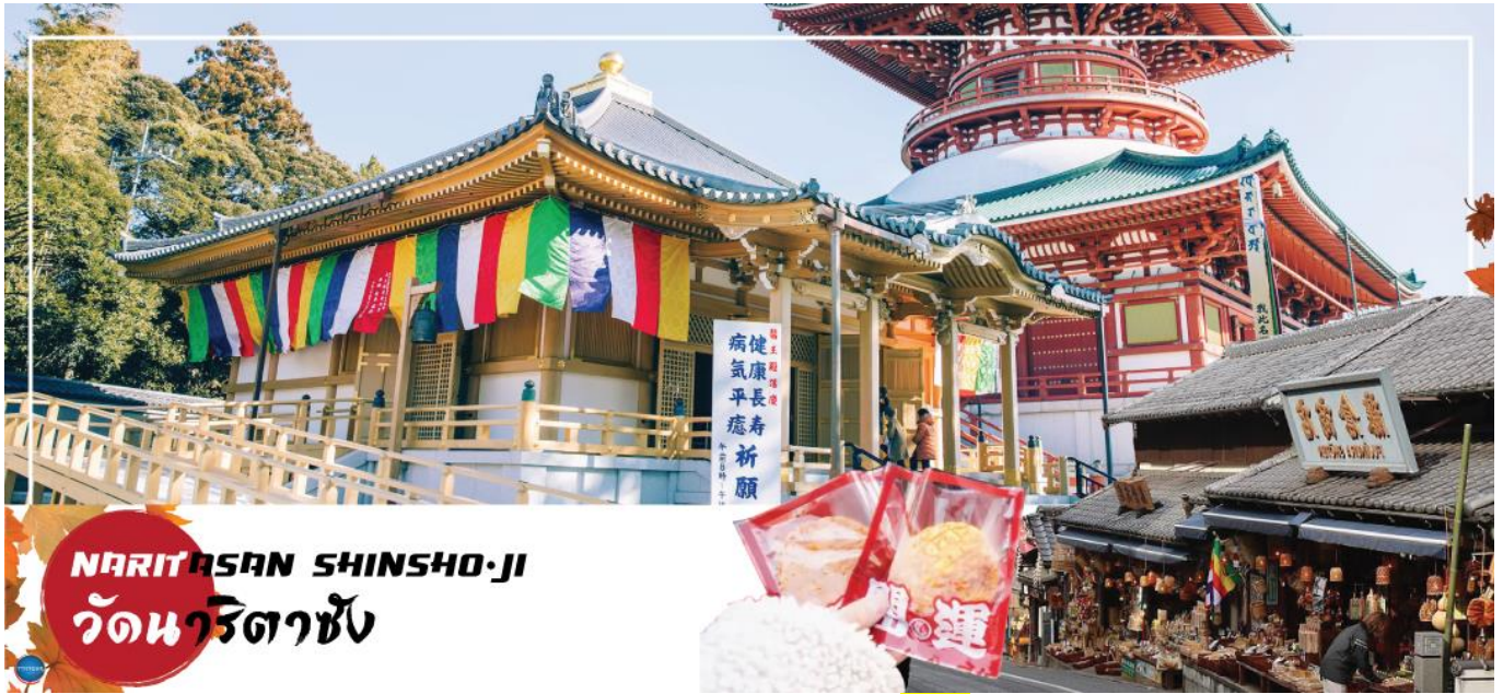
NARITASAN SHINSHO-JI วัดนาริตะชิน