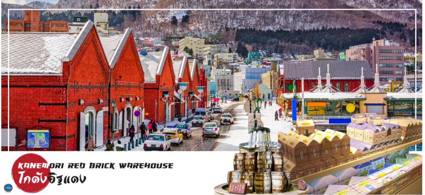
KANEMORI RED BRICK WAREHOUSE โกดังอิฐแดง

เมืองฮาโกดาเตะ – โกดังอิฐแดง – ย่านเมืองเก่าโมโตมาชิ – ป้อมโกเรียวกาคู (เข้าชม) – อุทยานแห่งชาติทะเลสาบโอนุมะ – ทะเลสาบโทยะ – ออนเซน