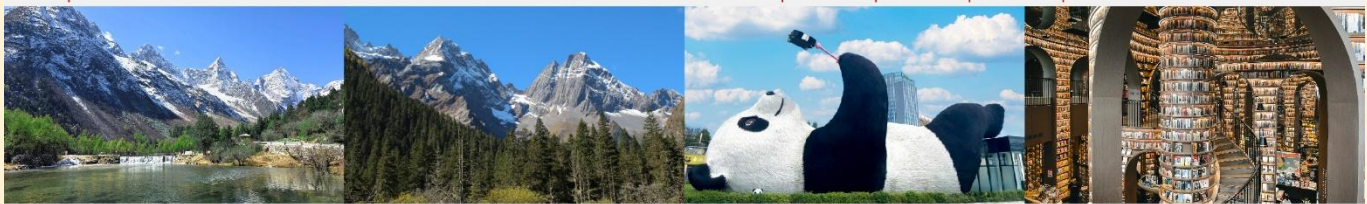
อุทยานแห่งชาติปี่เฟิงโกว