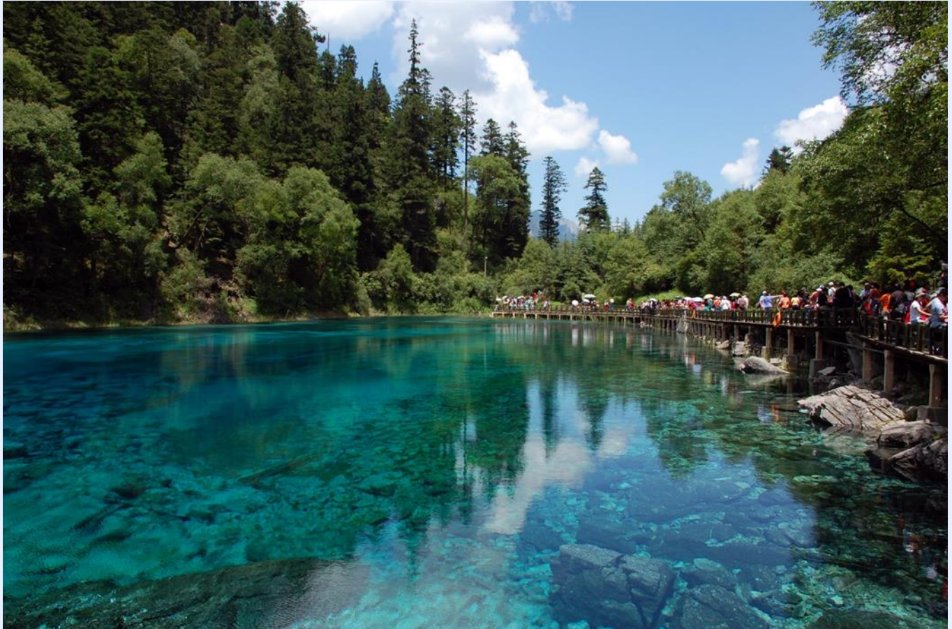
ฤดูใบไม้ผลิ (SPRING)

หมายเหตุ : โปรแกรมนี้ไม่รวมรถเหมาภายในอุทยานฯ หากท่านต้องการรถเหมาภายในอุทยาน มีค่าใช้จ่ายเพิ่มเติม สามารถสอบถามเพิ่มเติมจากไกด์ท้องถิ่นและหัวหน้าทัวร์