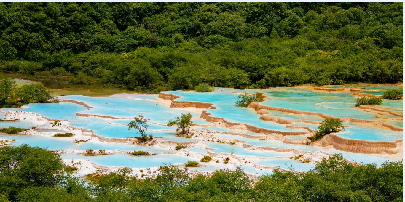
ฤดูใบไม้ผลิ (SPRING)