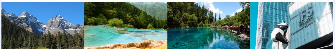
ภูเขาสี่ดรุณี (หุบเขาขงเจียวโกว) อุทยานแห่งชาติหวงหลง อุทยานแห่งชาติจิวจ้ายโกว แพนด้ายักษ์ปิ่นตึก IFS