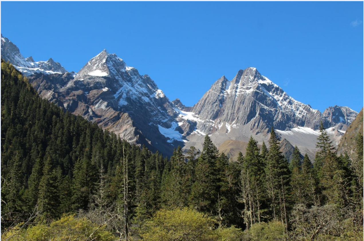
ฤดูใบไม้ผลิ (SPRING)