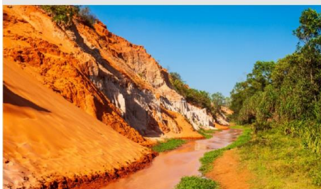
ลำธารนางฟ้า