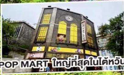
POP MART ใหญ่ที่สุดในไต้หวัน