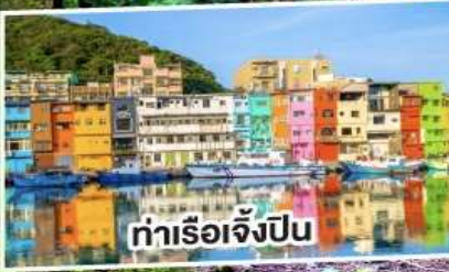
ท่าเรือเจิ้งปิ่น