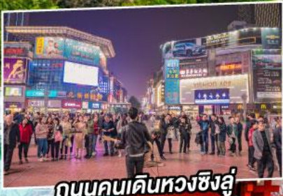
ถนนคนเดินหวงซิงอู่