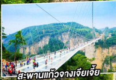
สะพานแกว่งเจียเจีย