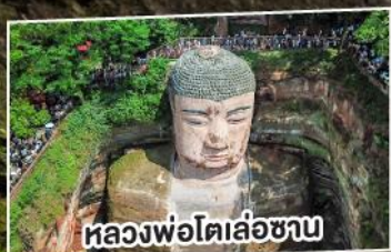
หลวงพ่อโตเล่อซาน