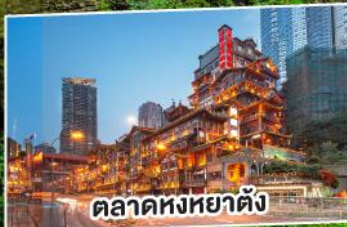
ตลาดหงหยาดัง