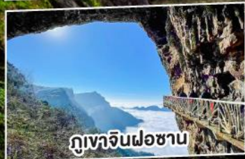
ภูเขาจินฝอซาน