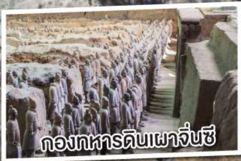
กองทหารดินเผาจีนซี