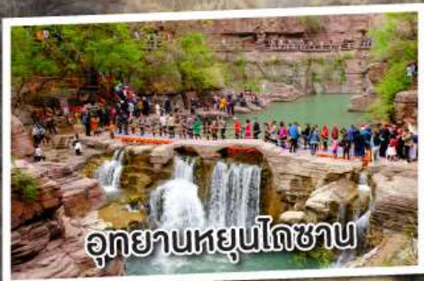
อุทยานหยุ่นโกซาน