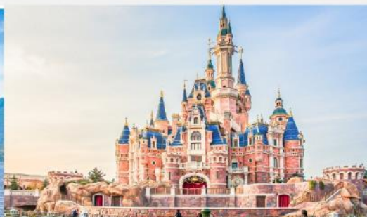
ดีสนีย์แลนด์