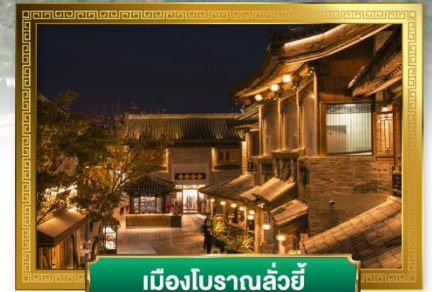
เมืองโบราณลั่วอี้