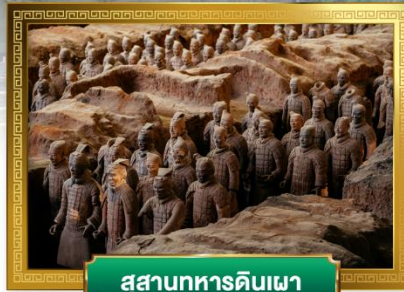
สุสานทหารดินเผา