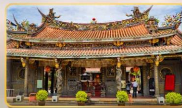
วัดต้าหลงตงเป่าอัน