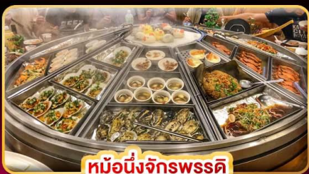
หม้อหนึ่งจักรพรรดิ

แพ็คเกจรวมตั๋วเครื่องบิน บินคุ้ม เที่ยวครบ เช็คนิวเจอร์ไฮไลท์