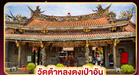
วัดต้าหลงตงเป่าอัน