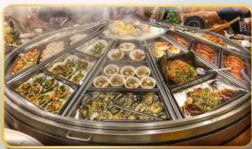
หม้อนึ่งจักรพรรดิ