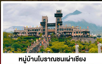
หมู่บ้านโบราณชนเผ่าเซียง