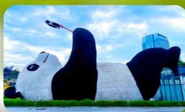
หมีแพนด้าเซลฟ์