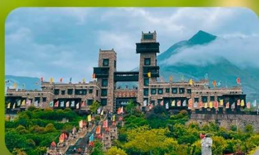
หมู่บ้านโบราณชนเผ่าเซียง