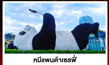
หมีแพนด้าเซลฟี