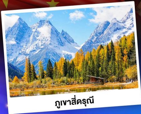
กู๋เขาสีดรุณี