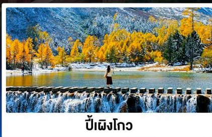
ปี้ฝิงโกว