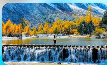
ปี้ผิงโกว