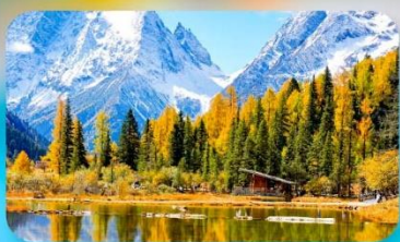
กุเวาสี่ดรุณี