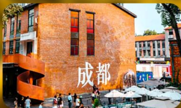
ตงเจียวจี้

HOLIDAY INN EXPRESS HOTEL หรือเทียบเท่า 4 ดาว