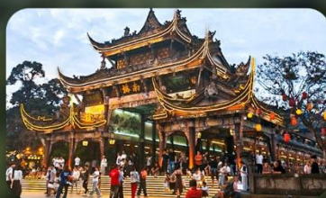
เมืองโบราณกวนเสี้ยน