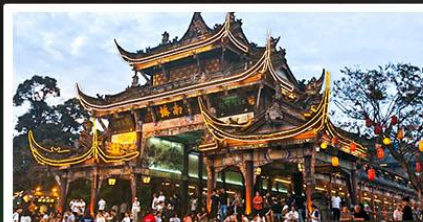
เมืองโบราณกวนเสียน