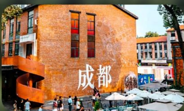
ดงเจียวจี้