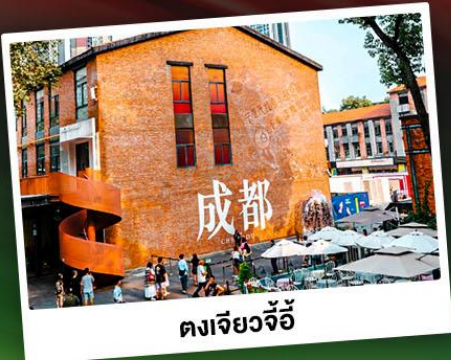
ตงเจียวจี้

เทือกเขาแอลป์แห่งเมืองจีน ชมความงามของ "อุทยานภูเขาซีครุณี"