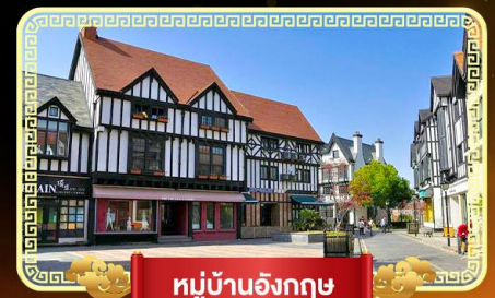
หมู่บ้านอังกฤษ