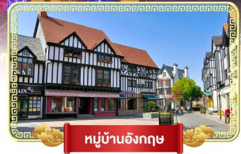
หมู่บ้านอังกฤษ