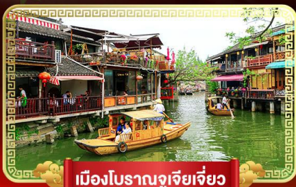
เมืองโบราณจูเจียเจี้ยว

เที่ยวสนุกในฝัน "ดิสนีย์แลนด์" ล่องเรือชมเมืองโบราณจูเจียเจี้ยว