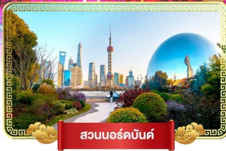
สวนนอร์มัลด์

• ถ่ายรูปเซ็คอินสวนนอร์มัลด์ เดินเล่นชิวเกียนตี้