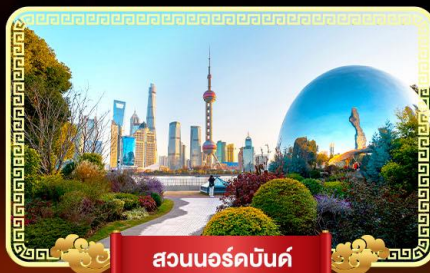
สวนนอร์ธบอนด์