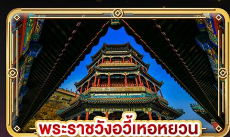
พระราชวังอ้วหนว่น