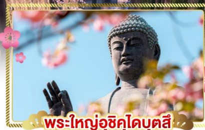
พระใหญ่อุซึคุโอบุตสึ