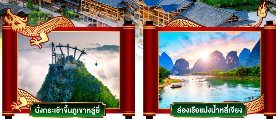
นั่งกระเช้าขึ้นภูเขาหลูอี้