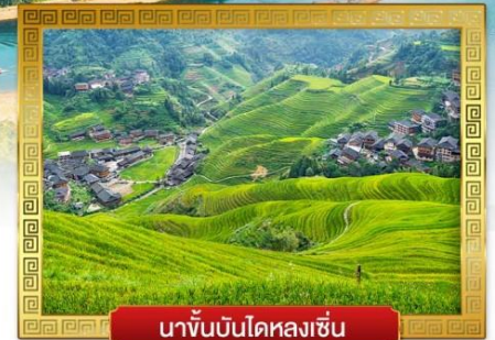
นาขั้นบันไดหลงเซ็น