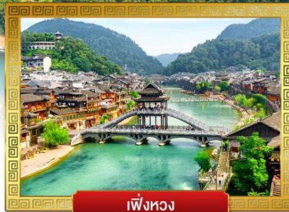
เฟิ่งหวง