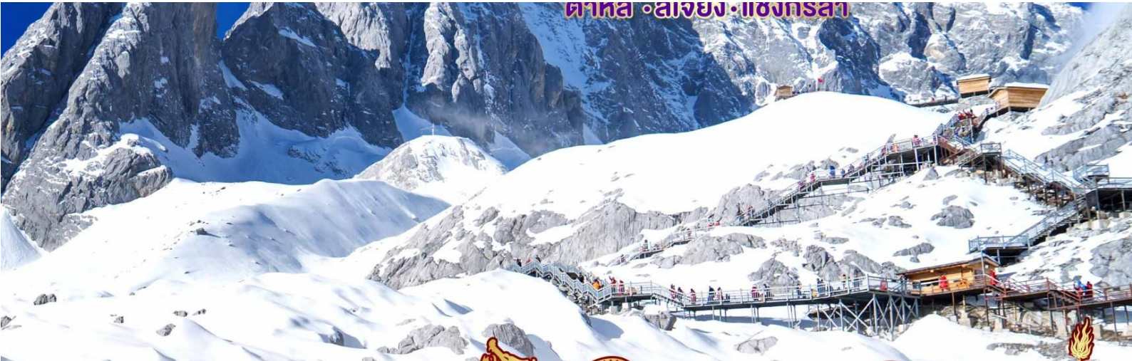
ตาหล • ลางยง • แซงกรลา