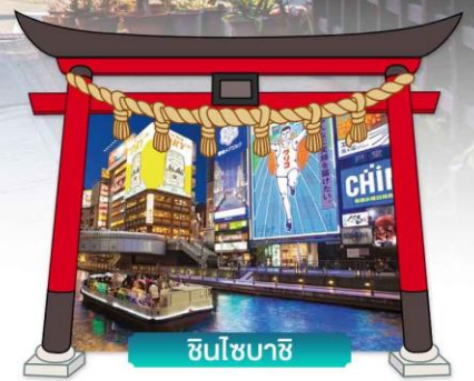
ชินโซนาชิ