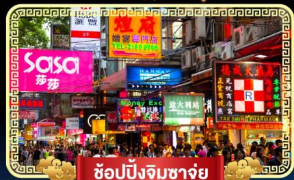
ช้อปปิ้งจิมซาจู้