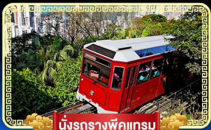
นั่งรถรางฟิคแรม

🇧🇹 นิงกระเซ้านองปิง 360 องศา บินลัดฟ้าไป...สู่เกาะฮ่องกง