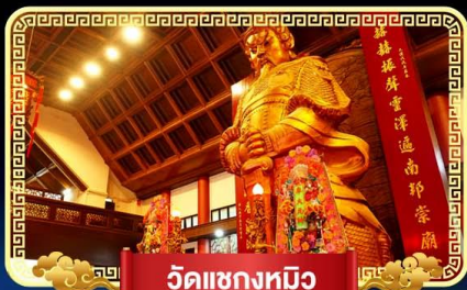
วัดเขงทมิว