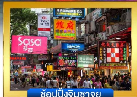
ช้อปปิ้งจิมซาจุ่ย