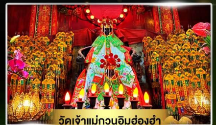
วัดเจ้าแม่กวนอิมฮ่องฮ่า