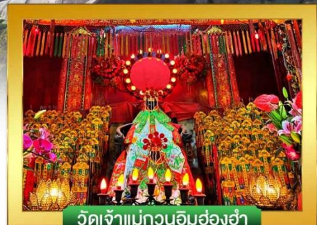
วัดเจ้าแม่กวนอิมฮ่องฮ่า