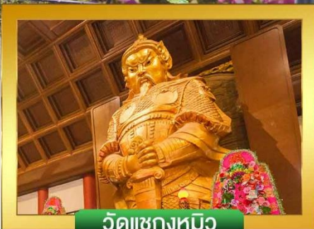
วัดเขากงหมี