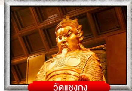
วัดเซ่งก้ง