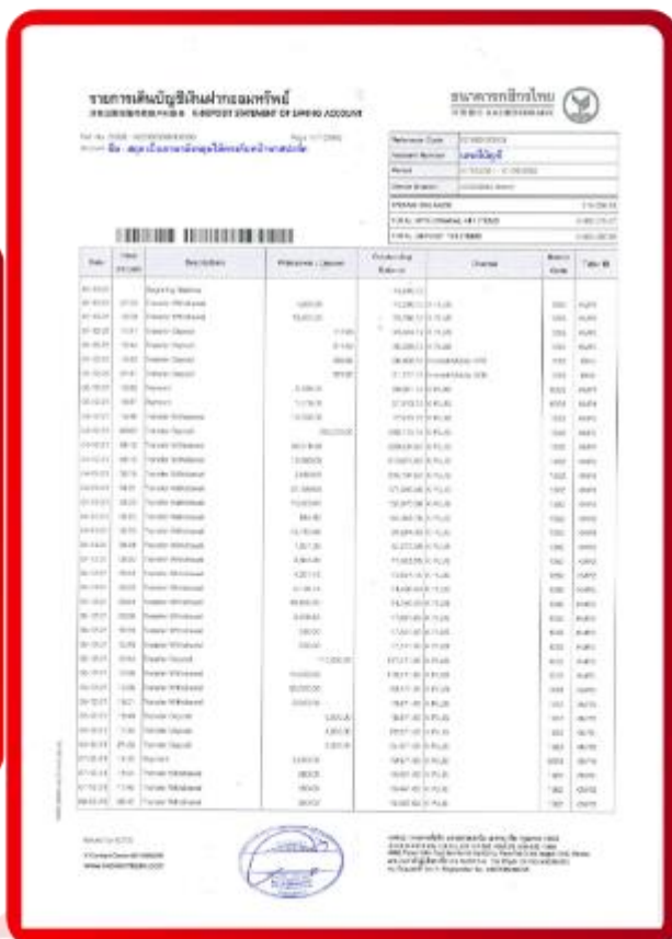
ตัวอย่าง Bank Statement ที่ผู้สมัครต้องขอธนาคาร

3.4 ปรับสมุดบัญชีธนาคารตัวจริง และเตรียมไปในวันที่ยื่นวีซ่า