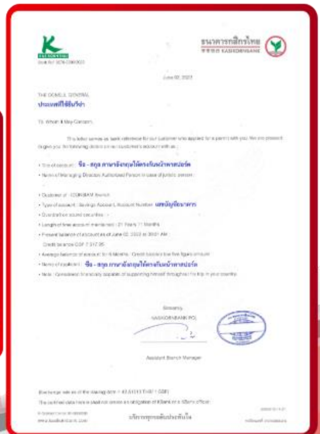
ตัวอย่าง Bank Guarantee ที่ผู้สมัครต้องขอธนาคาร