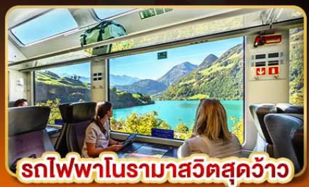
รถไฟพามาสู่วิวสุดสวย

📅 เดินทาง 14- 21 เม.ย. | 09-16 พ.ค. | 30-06 มิ.ย. 68