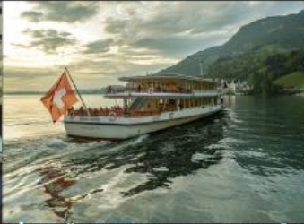
ล่องเรือชมวิวกะเสสาบลูเซิร์น