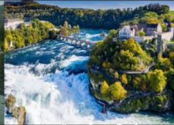
เขื่อนน้ำตกโรน