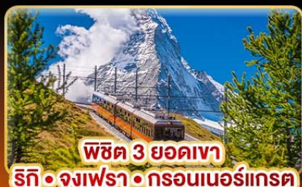
พีช 3 ยอดเขา ริทึ • จุงเฟรา • กรอนเนอร์เกรต