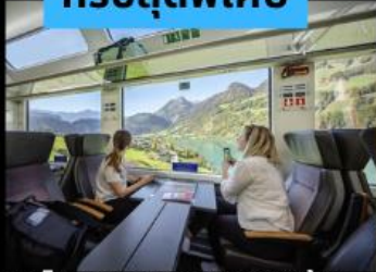
รถไฟ Panarama วิวดูทิวทัศน์