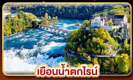
เขื่อนน้ำตกไรน์