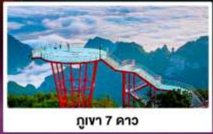
กูเขา 7 ดาว