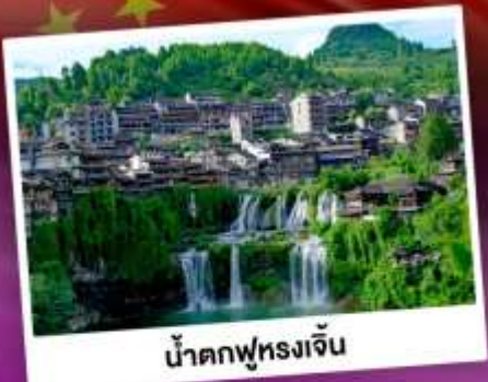
น้ำตกฟูรงเจิน