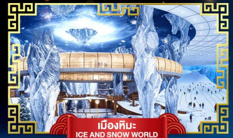
เมืองหิมะ ICE AND SNOW WORLD