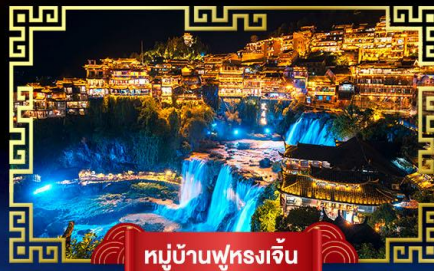
หมู่บ้านฟูรงเจิน