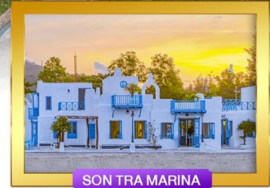
SON TRA MARINA