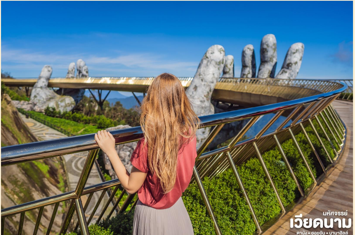
มหัศจรรย์ เวียดนาม คาบัง • ฮอยอัน • บานาฮิลล์

นำท่านชม สะพานสีทอง สถานที่ท่องเที่ยวใหม่ ล่าสุดตั้งโดดเด่นเป็นเอกลักษณ์อย่างสวยงาม บนเขาบานาฮิลล์ นำท่านสู่จุดที่สร้างความ ตื่นเต้นให้นักท่องเที่ยวมองดูอย่างอึ้งการที่ซึ่ง เต็มไปด้วยเสน่ห์แห่งตำนานและจินตนาการ ของการผจญภัยที่ สวนสนุก The Fantasy Park (รวมค่าเครื่องเล่นบนสวนสนุก ยกเว้น