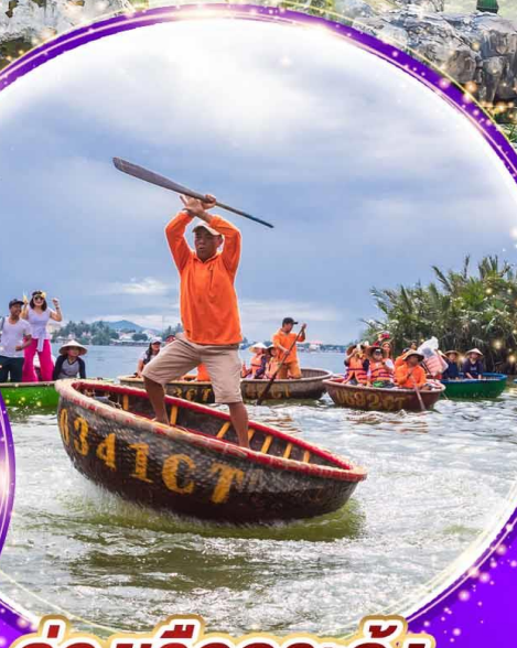
ล่องเรือกระด้ง

นั่งกระเช้าที่ยาวที่สุดในโลก ขึ้นสู่บานาฮิลล์