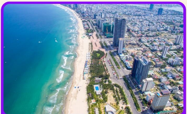
เช็किन ชายหาดหมีเคอ เป็นชายหาดที่สวยงามที่สุดในเมืองดานัง