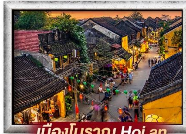
เมืองโบราณ Hoi an