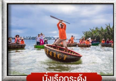
นั่งเรือกระดัง