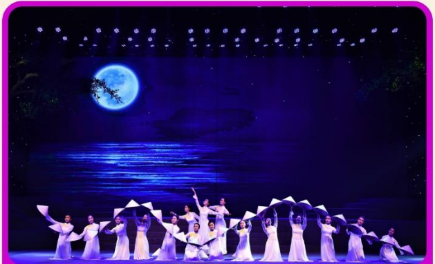
ชมการแสดง Charming Show Danang