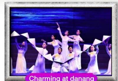
Charming at danang