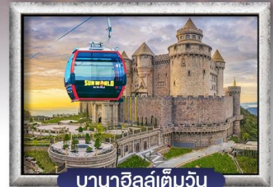
บาน่าฮิลล์เต็มวัน