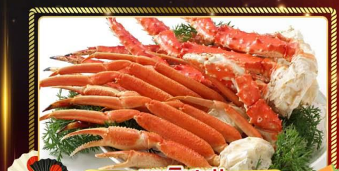
เมนูพิเศษ!! บุฟเฟ่ต์งาช้าง 3 ชนิด